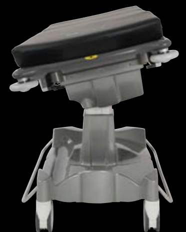
+/- 12° laterale Verstellmöglichkeit