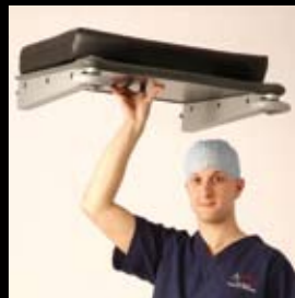
Ultraleichtes, abnehmbares Fußteil