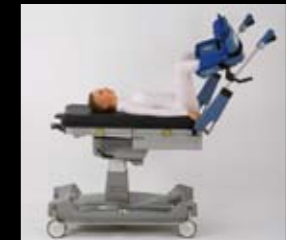
Zum Fußende verschiebbare Patientenauflage. Fußteil entfernbar.