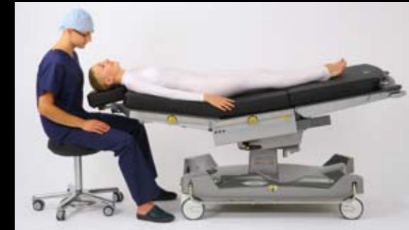
Patientenauflage mit Kopfteil für bessere Zugänglichkeit. Speziell angepasste Kopfkalotte für die Ophthalmoskopie.