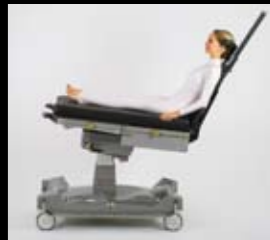
Fußteil entfernbar. Eine optionale Arthroskopie-Rückenlehne kann angebracht werden.